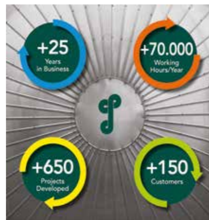
CHEMPROD IN NUMERI CHEMPROD IN NUMBERS

Their distinguishing features are skill and speed of analysis in project problematics and the ability to identify best solutions even in the development of unconventional projects. Production capacity with a high technological content amounts to over 70,000 working hours/year, making the Company a point of reference for the sector. CHEMPROD accompanies the Customer through all the project phases: from project design and feasibility studies to detailed engineering and specialist assistance in the construction phase, to trouble-shooting in plant management. With its dynamic, open-minded approach, CHEMPROD is able to collaborate with small, medium or large Companies. Twenty-five years in the sector have provided CHEMPROD with comprehensive experience and a capacity to take on projects of diverse complexity and proportions, with attention to the latest innovations and without neglecting issues of environmental sustainability and energy saving.