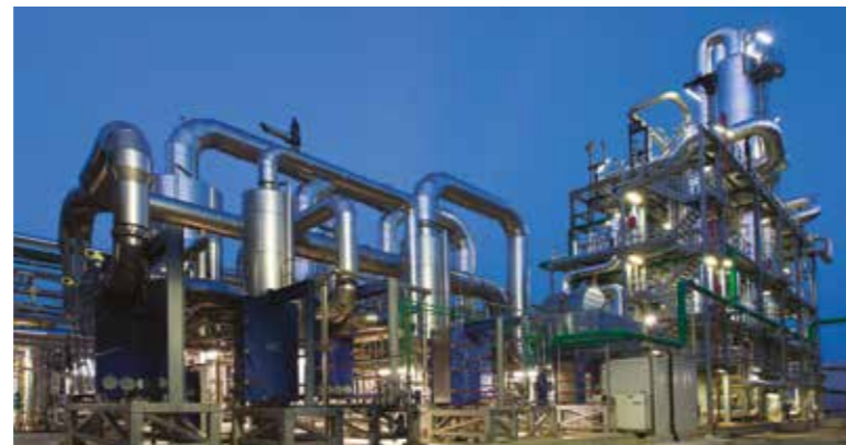
IMPIANTO ETANOLO - PERÙ ETHANOL PRODUCTION PLANT - PERÙ

Now a Multi-disciplinary Engineering Company, CHEMPROD was established in 1995 as a Process Consulting Company for the petrochemical and Oil & Gas industries. Over time, the company has broadened its range of activities to include the pharmaceutical, manufacturing and green energy sectors. First-class technical competence, expertise and a team open to new challenges make possible CHEMPROD's eclectic, flexible and rigorous project approach. The Process Department is the strategic and creative core of the Company and is now flanked by the Piping, Instrumentation and Graphics Departments to provide a multitude of skills capable of developing projects in any or all fundamental disciplines.