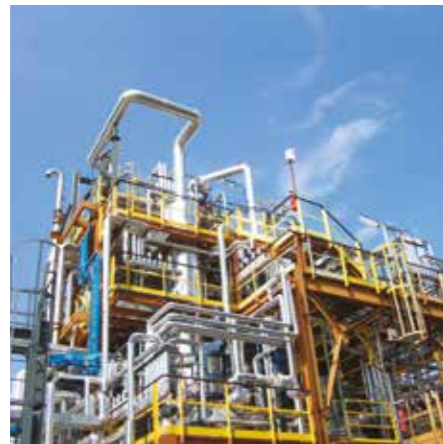
IMPIANTO 3,4 - DICLOROBENZOTRIFLUORURO (DCBTF) DCBTF PRODUCTION PLANT - ITALY

Now a Multi-disciplinary Engineering Company, CHEMPROD was established in 1995 as a Process Consulting Company for the petrochemical and Oil & Gas industries. Over time, the company has broadened its range of activities to include the pharmaceutical, manufacturing and green energy sectors. First-class technical competence, expertise and a team open to new challenges make possible CHEMPROD's eclectic, flexible and rigorous project approach. The Process Department is the strategic and creative core of the Company and is now flanked by the Piping, Instrumentation and Graphics Departments to provide a multitude of skills capable of developing projects in any or all fundamental disciplines.