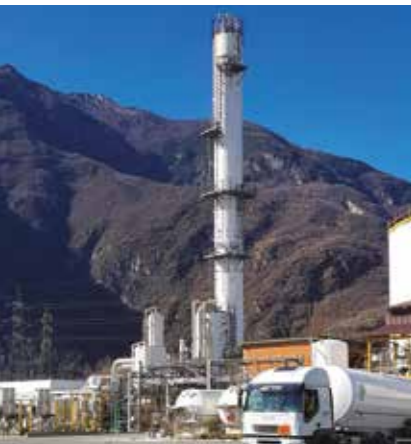
IMPIANTO FRAZIONAMENTO ARIA - ITALIA AIR SEPARATION PLANT - ITALY